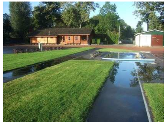
De watergevoelige stormbaan