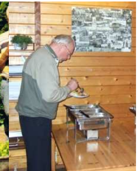
rondenteller ontsteker bevrijdingsvuur en toespraak-lid van de baanploeg met lekker eten.