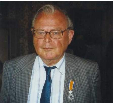
Ridder in de orde van Oranje Nassau